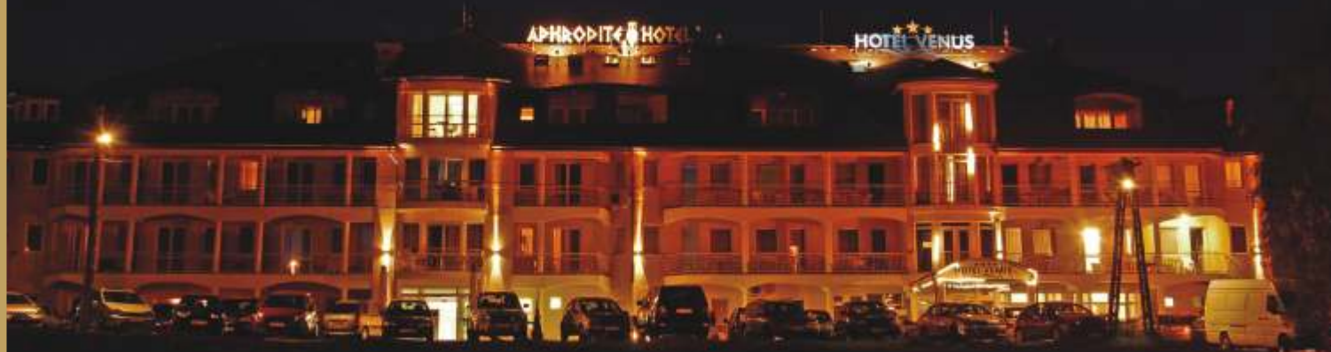
éjszakai látkép az Aphrodite**** és a Venus*** Hotel szárnyakkal